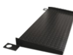
Rampa de acceso