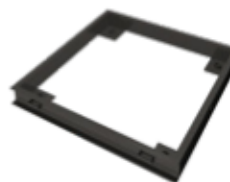
Cubillaje para empotrar