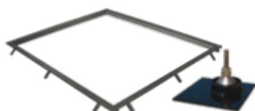
Marco para empotrar con placas de anclaje